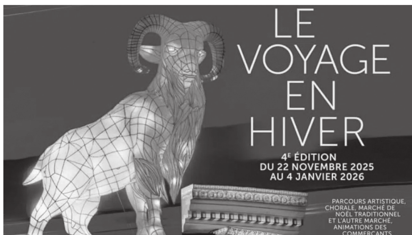
Альтернативная версия рождественской инсталляции в г. Нант (Франция)

Яркой иллюстрацией этого процесса, достигшего в ряде стран Европы своего логического предела, служит трансформация празднования Рождества Христова. Во Франции, например, мы наблюдаем последовательный переход от десакрализации к прямой дехристианизации: рождественские базары официально переименовываются в «другие базары» ( autre marché ) или в «зимние прогулки» (« voyage en hiver ») [5], а традиционные символические инсталляции (Рождественский вертеп, елка) уступают место нейтральным или альтернативным образам (см. рис.). Этот сдвиг является не просто изменением декора, но глубинной смысловой подменой, целенаправленно стирающей сакральную основу праздника.