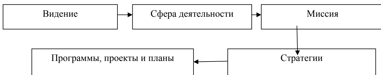
Рис. 1. Последовательность разработки компонентов стратегического управления

Выработка стратегии является прерогативой руководителей высшего звена. Она охватывает различные организационные структуры (отделы, сектора, службы и другие) библиотеки. Составляющими стратегического управления являются: видение, сфера бизнеса, миссия, стратегии и программы и планы. Последовательность их разработки указана на рисунке 1.