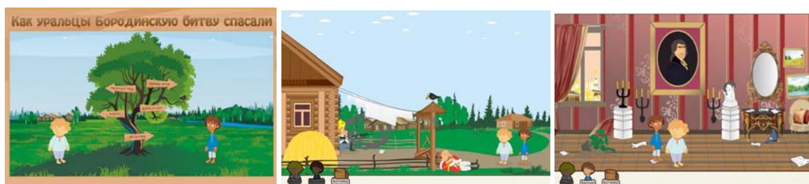
Примеры оформления игры

бота практически останавливалась. Рабочую группу преследовал жесточайший цейтнот. С переменным успехом боролись с «лишним весом» графики, несовместимостью программного обеспечения, не хватало опыта работы над таким объемным проектом. Тем не менее мы справились. И говорим всем, кто рискнет повторить опыт Челябинской областной юношеской библиотеки: создание компьютерной игры в библиотеке только собственными силами, без привлечения квалифицированных специалистов разного профиля, невозможно. Но найти превосходную идею, собрать команду единомышленников, обеспечить информационную поддержку и сопровождение проекта и реализовать эту идею – вполне под силу. Мы это сделали, сумеете и вы. Так даешь умные и бесплатные компьютерные игры для новых поколений от всех библиотек страны!