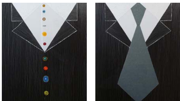
Рис. 3. Серия «Пары». 2016. 100x85. Х., м.

Работы скорее визуальные, чем вербальные отличает более высокая образно-художественная выразительность. Таковы практически шедевральной по степени искренности сопереживания картина «Фокус не удался», а также «Желтая ночь» (2006. 40x50. Х., м.). Серьезная до трагичности работа «Фокус не удался» (рис. 4) посвящена извечной любовной войне мужского и женского миропонимания. На картине разъяренная на части одинокая душа-женщина, доверившаяся фокуснику-мужчине, трусливо спрятавшемся в кулисы, выставлена на обозрение дикой и жадной до кровавых сенсаций толпы, которую художник изобразил как орнамент из глаз, носов и ртов на фоне мрачной черноты зрительного зала.