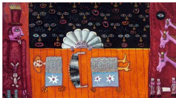
Рис. 4. Фокус не удался. 2007. 140x70. Х., м.

Работы скорее визуальные, чем вербальные отличает более высокая образно-художественная выразительность. Таковы практически шедевральной по степени искренности сопереживания картина «Фокус не удался», а также «Желтая ночь» (2006. 40x50. Х., м.). Серьезная до трагичности работа «Фокус не удался» (рис. 4) посвящена извечной любовной войне мужского и женского миропонимания. На картине разъяренная на части одинокая душа-женщина, доверившаяся фокуснику-мужчине, трусливо спрятавшемся в кулисы, выставлена на обозрение дикой и жадной до кровавых сенсаций толпы, которую художник изобразил как орнамент из глаз, носов и ртов на фоне мрачной черноты зрительного зала.