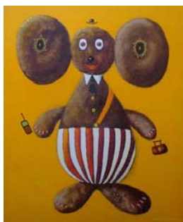
Рис. 2. Идентификация Чебурашки. 2016. 99x79. Х., м.

является «визуализацией крылатых выражений: “Любовь-морковь”, “Сапоги-сорокоходы” или “Скатерть-самобранка”». К примеру, картина «Ковер-самолет» (2008. 100x150. Х., м.) изображает ковер с прорезанным в нем самолетом, контуры которого стилизованы под детское творчество. В эту же идейно-содержательную систему можно вписать и работы, выполненные совсем недавно, к примеру, «Идентификация Чебурашки» (рис. 2) или холсты из серии «Пары» того же года (рис. 3).