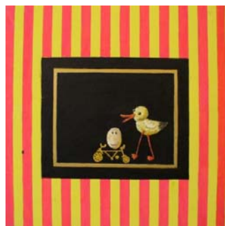
Рис. 5. Картина. 2010. 70x70. Х., м.

В работе «Картина» (рис. 5) нарисованное изображение на черно-глубоком фоне-пространстве живее и объемнее жизни реальной, плоской и предсказуемой, как обои в вертикальную полоску с назойливым узором. То есть мир субъективных образов, придуманных художником, оказывается как для автора, так и для зрителя более реальным и интересным, чем объективная действительность. Холст в целом несет довольно позитивный, радостный настрой и отличается отсутствием негативных и излишне деформированных персонажей.